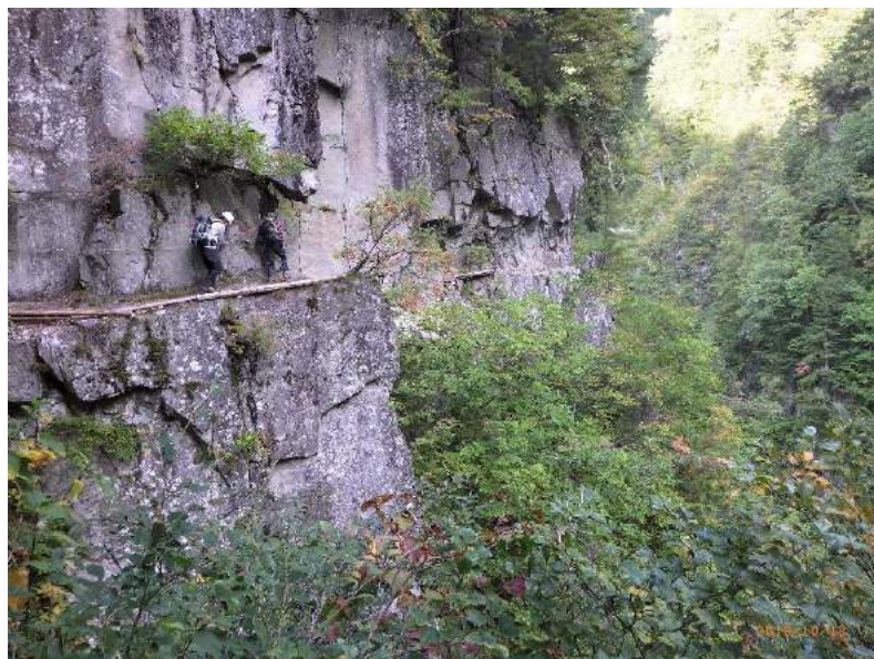
『黒部峡谷 下の廊下』