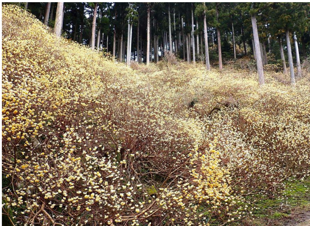
「高畑山の斜面に咲くミツマタ」