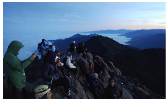
(山頂は大賑わい玉山東峰方面)