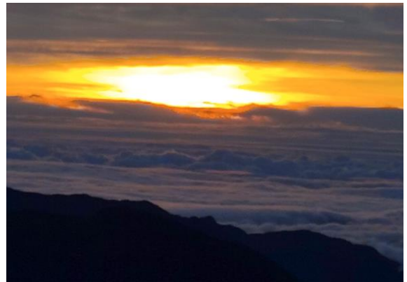
(山頂からの夜明け)